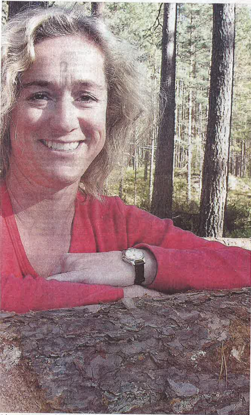
I skognæringa. Ho ivrar for å få fleire kvinner inn i næringa. Som einaste kvinne blir ein veldig synleg, seier ho.