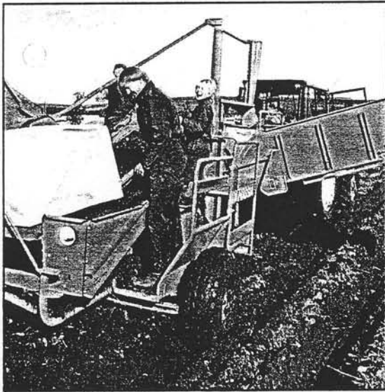
Spesialisert dyrking med krav om moderne utstyr har jaga mange bort frå potetdyrkinga.